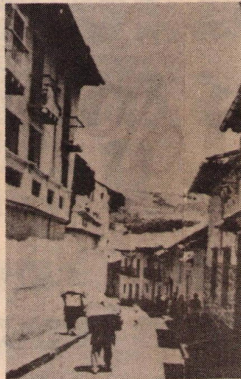
Quito necesita algo más que un maquillaje.

Además, el humo de los automóviles que cruzan de sur a norte