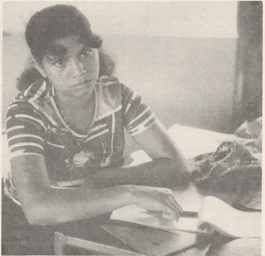
Entre los 25 jóvenes encuestados sólo uno dijo que estudia para ser útil a la sociedad.

Preguntados los 25 estudiantes en referencia acerca de “cuándo estudiaban”,