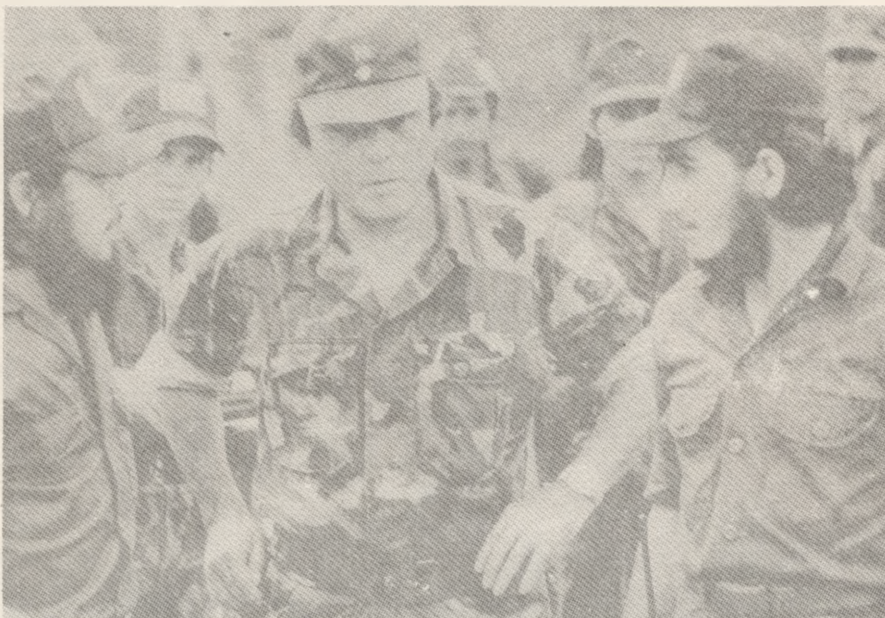
Enrique Bermúdez (al centro) principal estrategia militar de los contras.

Muchos ciudadanos norteamericanos consideran que el embargo es ilegal e in-moral. Más de 62.000 estadounidenses han firmado la "Promesa de Resistencia", por la cual ellos han prometido oponerse a cualquier escalada militar norteamericana en Centroamérica. El 7 de mayo, más de 1.600 ciudadanos fueron arrestados por protestar en contra del embargo. (UPDATE, WOLA, Washington 6/85)