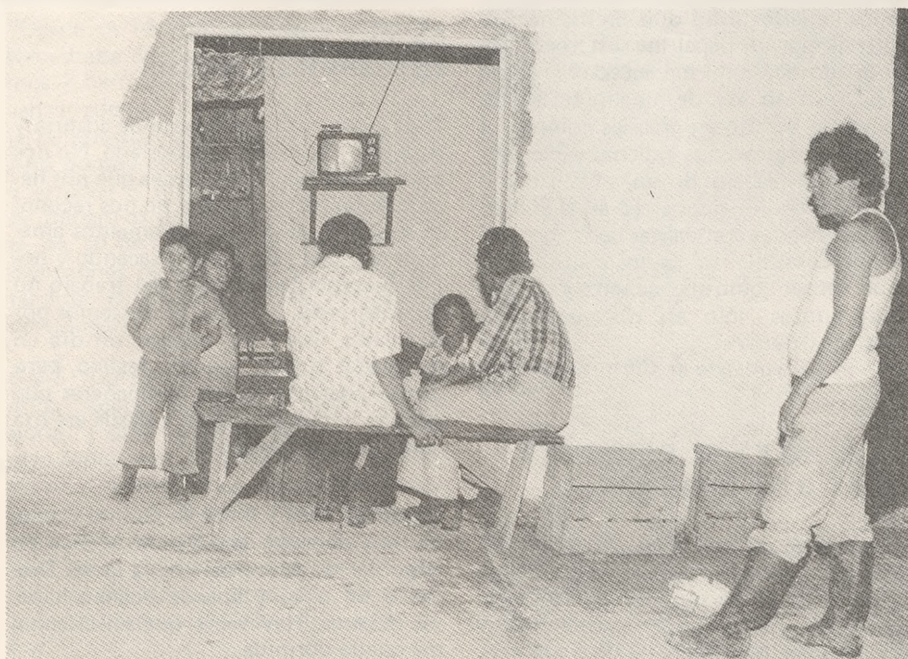
Los medios masivos en nuestro país no toman en cuenta las verdaderas necesidades del pueblo.

Mucho queda por reflexionar y concientizarnos sobre los derechos que todos tenemos de controlar de alguna manera nuestra propia educación y la de nuestros hijos. Hace falta crear conciencia del derecho inalienable que tenemos cada uno de nosotros a comunicar, a dialogar, a decir nuestra palabra a través de todas las tecnologías existentes. Sólo así podremos algún día hablar libremente y hacer realidad una verdadera libertad de expresión y una verdadera comunicación popular.