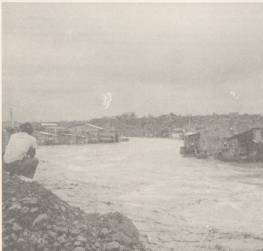
La sociedad niega a los jóvenes la posibilidad de superarse.

Los mayores índices de desempleo por provincias, en 1982, correspondían a Guayas, 9.8o/o; Esmeraldas, 8.4o/o; El Oro, 7.1o/o, y Manabí, 6.8o/o. (Bilbao, Luis. Seminario Desempleo y Subempleo)