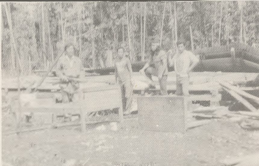
En el desalojo de la Precooperativa "Sendero Progresista" Cantón Palora, son arrasadas sus viviendas.

Dos socias de la Precooperativa "La Fiera", que funciona en otro sector de la