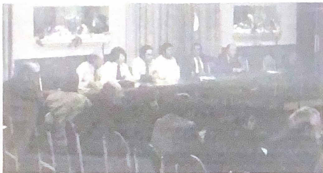
Reunión de la CUTA: ¿se acabó la unidad?

Fueron varias las personalidades argentinas que, a través del mes de mayo, llamaron la atención sobre la existencia de dos Argentinas: la de los de arriba y la de los de abajo. Esta realidad también se refleja desde hace ya mucho tiempo en el movimiento obrero.