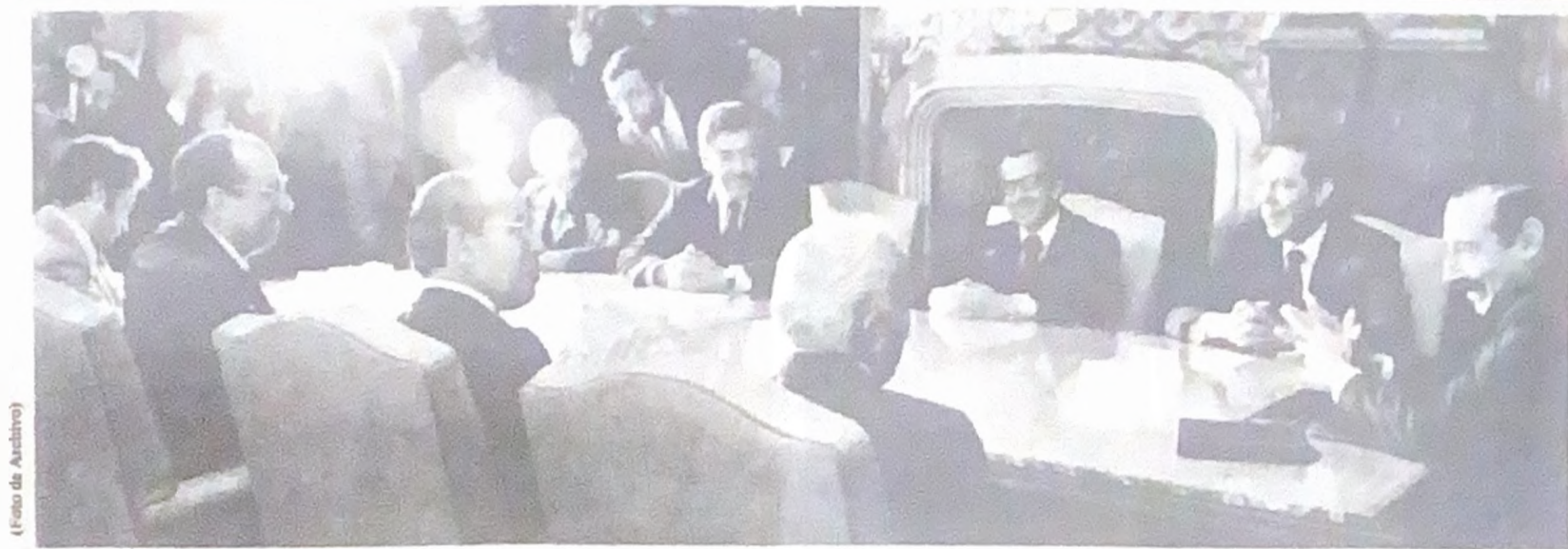
La CIDH se reúne con el General Videla al llegar a Buenos Aires para hacer su investigación

Dice el informe en relación a la respuesta del gobierno argentino: «Las explicaciones del gobierno han sido extremadamente inadecuadas e inconvincentes. La mayor parte de las res-