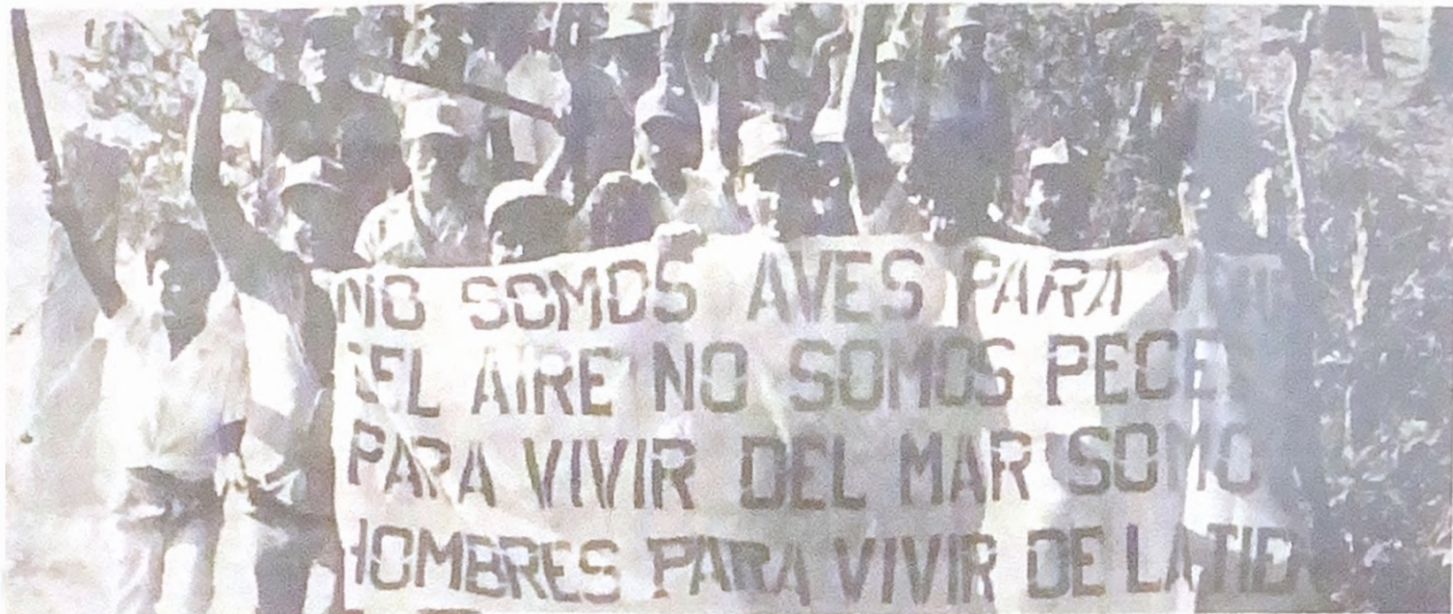
Campesinos nicaragüenses: ¡vivir como hombres libres!

El 10 de mayo de 1980, «Denuncia» entrevistó a Víctor Tinoco, Embajador del gobierno de Nicaragua ante las Naciones Unidas. Estas fueron sus declaraciones: