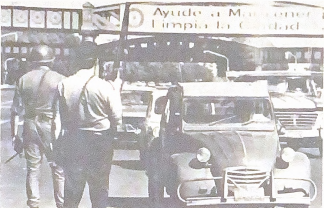
La represión no ha frenado el accionar de los familiares.

Para el 28 de diciembre de 1979 la Comisión de Familiares de Desaparecidos y Detenidos por Razones Políticas y las Madres de Plaza de Mayo decidieron colocar una ofrenda floral al pie del monumento al general San Martín con una cinta que decía «POR UN 1980 SIN PRESOS NI DESAPARECIDOS».