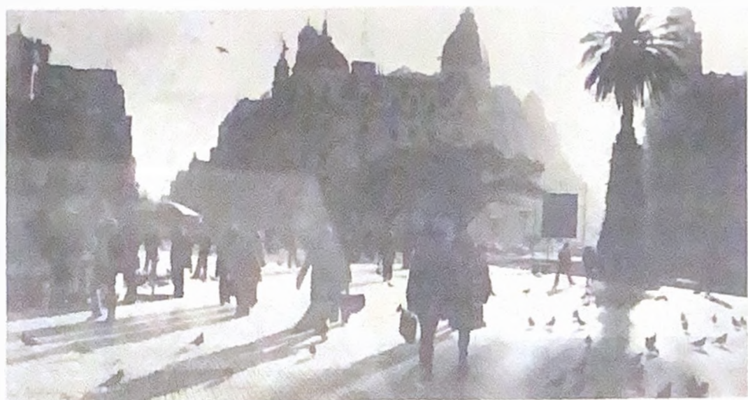
La Plaza de Mayo. Un símbolo

Con el ánimo cada vez más fortalecido, las Madres de Plaza de Mayo, se han convertido en un verdadero pilar de la resistencia del pueblo argentino a la Dictadura Militar. A continuación, las declaraciones de una de las integrantes del Movimiento hechas en forma exclusiva para nuestro corresponsal en Buenos Aires.