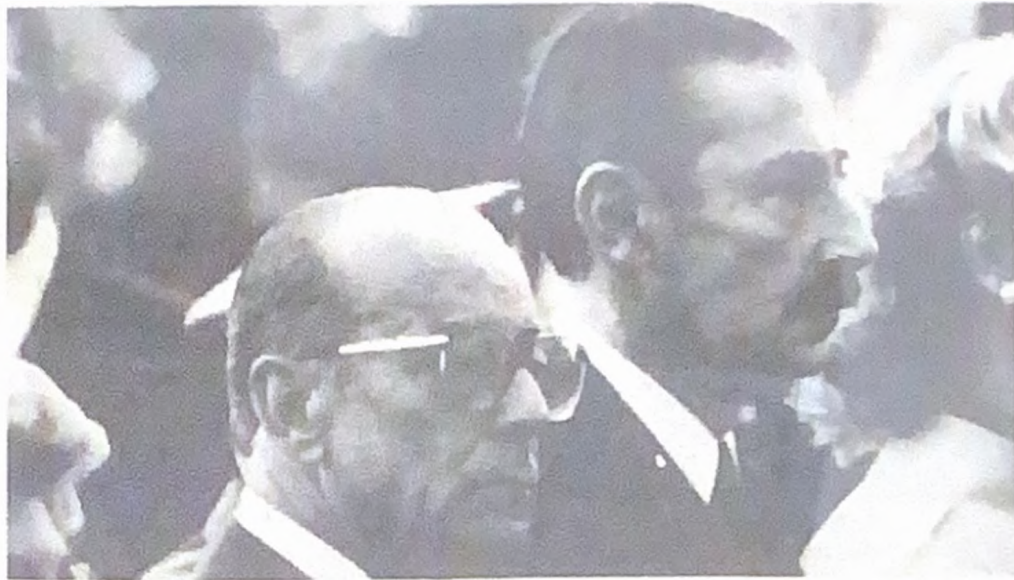
Presidentes militares Generales Figueiredo y Videla. Cono Sur, subordinación y hegemonía

El mismo Canciller Pastor fue protagonista después de una nueva derrota internacional de la Junta, esta se inscribe en el marco de una capitulación total en las principales reivindicaciones de la Argentina frente a las concepciones geopolíticas brasileñas en torno de la cuestión del Plata. Tal capitulación provocó un gran malestar en diversos sectores nacionalistas de derecha y militares afines y liberales como el que encabezaba el Almirante Rojas, ex vicepresidente luego del golpe que derrocó a Perón. Buenos Aires ha con-