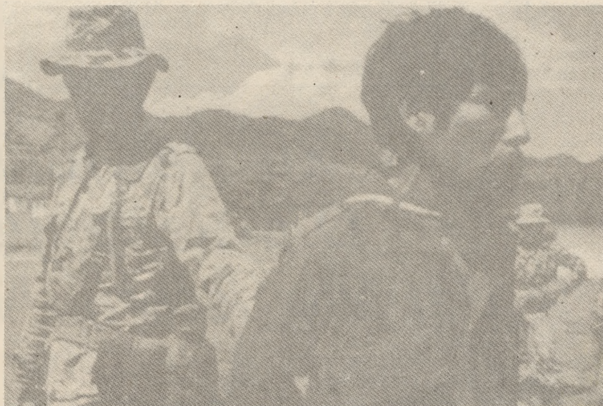
"Amarrarlos así", dijo, "con las manos atrás, pasar la cuerda por aquí (alrededor del cuello). . ."

Ejemplo de estas luchas lo encontramos en el triunfo de los trabajadores de Coca-Cola, que con el apoyo de otros sectores populares, tanto nacionales como internacionales, alcanzaron sus objetivos principales: conservar su fuente de trabajo y el reconocimiento de su sindicato; en la actividad de los trabajadores de CAVISA, quienes además de denunciar la represión que sufren sus dirigentes y la violación a los derechos humanos, han manifestado públicamente su rechazo a la ma-