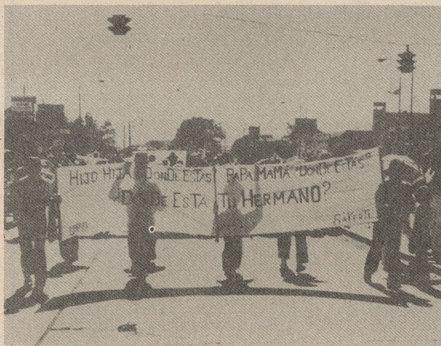
Amnistía Internacional - Sección especial para América Central (CASA)