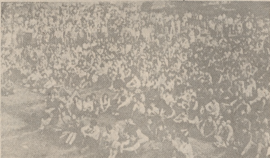
Los estudiantes han entrado en una reactivación de sus luchas tanto propias como en solidaridad con otros sectores populares.

El triunfo de los trabajadores del sindicato de Coca-Cola, apoyados por la solidaridad tanto nacional como internacional lograron conservar su fuente de trabajo; el paro laboral de ocho horas realizado por las operadoras de SUATEL en demanda de aumentos salariales, el paro de ochenta centros de