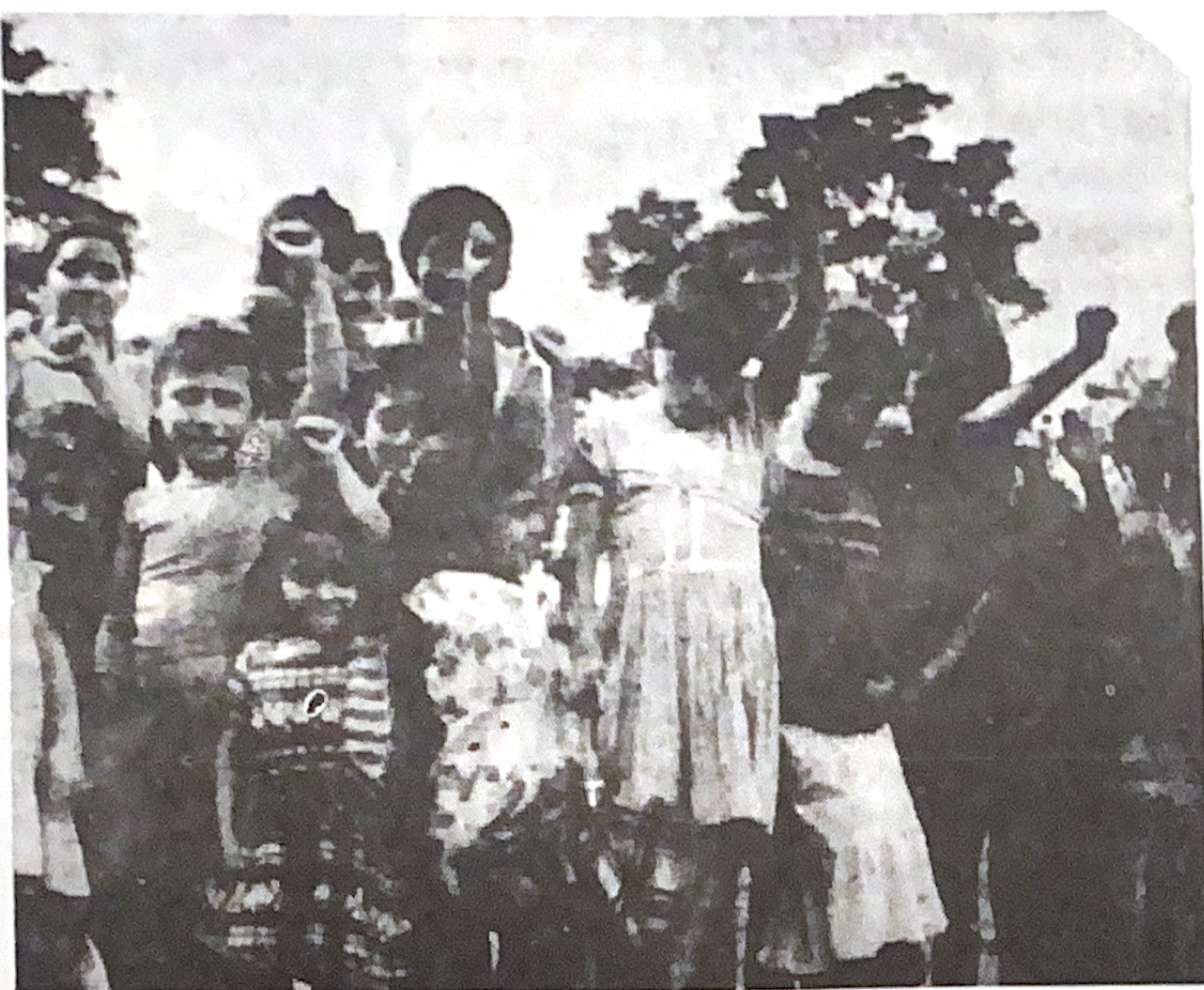
EL FUTURO DE AMERICA LATINA ESTA EN JUEGO EN LA LUCHA DEL PUEBLO SALVADOREÑO.

La Comisión Ecuménica de Derechos Humanos rechaza esta medida que conllevaría al mayor sufrimiento del Pueblo, y la prolongación de la guerra elevando los costos sociales a niveles sin precedentes.