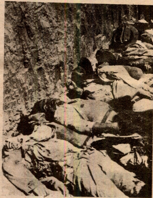
La fosa común para ocultar los cadáveres.