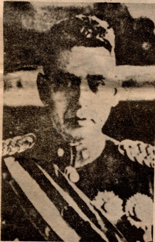
General Maximiliano Hernández Martínez, Presidente de El Salvador de 1931 a 1944.