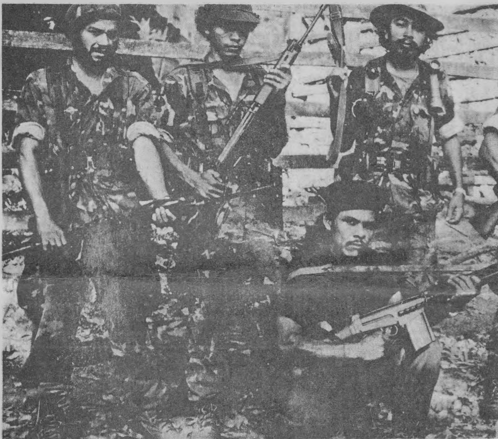
Una de las bandas contrarrevolucionarias patrocinadas por la CIA que operan desde Honduras. Una de estas bandas degolló la pasada semana a 8 campesinos e incineró los padrones electorales de esa parroquia.

En los considerandos del decreto en referencia se señala que a pesar del incremento último de las agresiones externas contra Nicaragua, el gobierno ha iniciado ya el proceso electoral, brindándole las garantías necesarias para que éste se desarrolle dentro de las condiciones institucionales de pleno respeto al voto de los nicaraguenses.