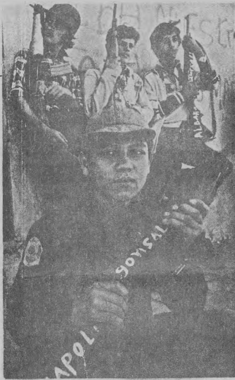
1.600 Km cuadrados de territorio ocupado por más de 1.500 combatientes del FMLN.

Cojutepeque. En este caso el FMLN informó haber recuperado 5 fusiles M-16 y causado 40 bajas al ejército.