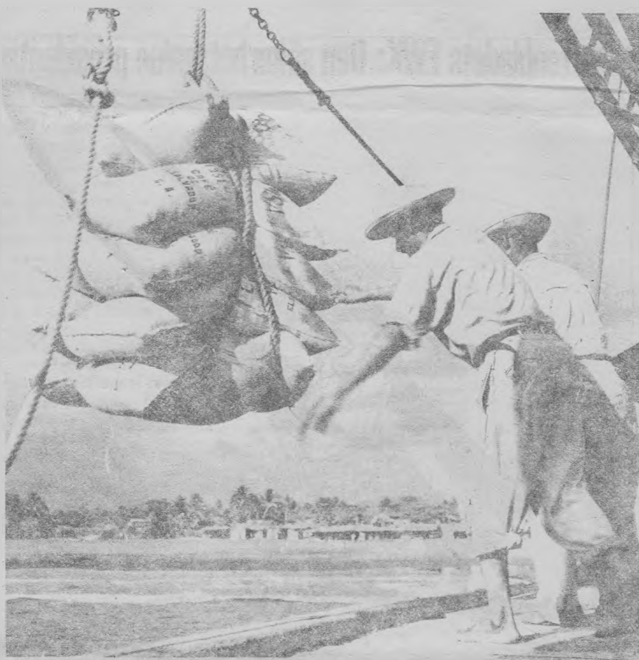
El gobierno de Magaña compensa la caída de las exportaciones con mayores préstamos concedidos por los Estados Unidos

A estos elementos de discordia se suma el conflicto civil que enfrenta desde hace tres años el ejército con el FMLN.