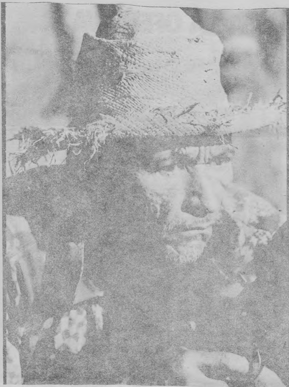
La fuerza del FMLN radica en su integración popular.

La guerrilla atacó San Salvador. Grupos procedentes del volcán Guazapa atacaron 10 puntos de la capital, quedando la ciudad sin energía eléctrica. Consultados oficiales del ejército reconocieron por lo menos 122 bajas en lo que va de la ofensiva del FMLN. El presidente Magaña habló en la celebración del tercer aniversario del golpe militar de octubre de 1979, pidiendo a la guerrilla deponer las armas. Mientras tanto las tropas que luchan en el noreste pidieron nuevos refuerzos militares. Prácticamente quedó cortado el país en dos mitades