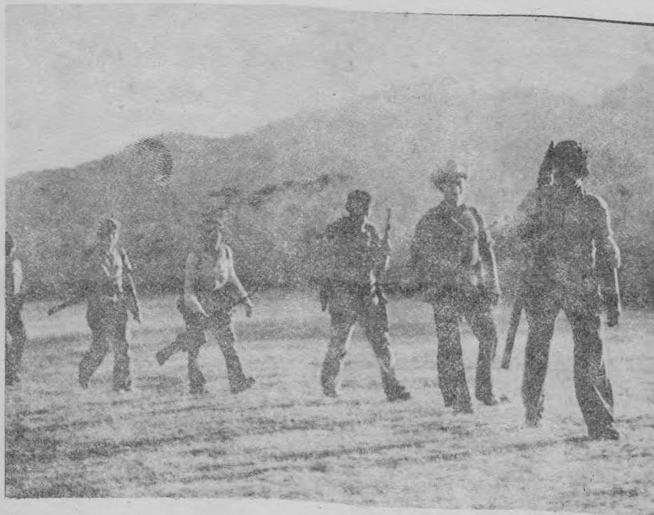
Desde mediados de octubre el FMLN acosa a las fuerzas militares apoyadas por los Estados Unidos.

Las fuerzas guerrilleras habrían neutralizado la contraofensiva del ejército y retenido seis ciudades en dos provincias del país. El revés se produce luego de que el ministro de Defensa y los comandantes locales afirmaron que sus fuerzas retomaron Perquín. En Chalatenango, el FMLN derrotó a las tropas del ejército en Jícaro, Las Vueltas y San José. Por segundo día el FMLN atacó con fuego de mortero