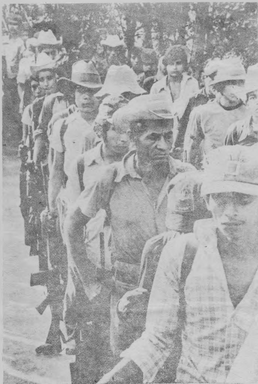
Un pueblo consciente en armas es invencible.

Cinco mil soldados luchaban hoy contra guerrilleros en el departamento norteño de Chalatenango encontrando una inesperada y firme resistencia. Fuentes oficiales reconocen que estas operaciones del FMLN son las mejor coordinadas desde el 28 de marzo. Siguen llegando refuerzos para retomar Las Vueltas, ciudad a 90 kilómetros al norte de San Salvador ocupada por unos 700 guerrilleros. El FMLN asegura controlar Perquín, Las Vueltas, Torola, San Fernando y Berlín. (AP y AFP).