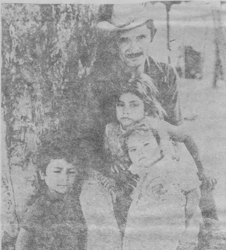
Los Estados Unidos regionalizan la guerra. El terror de los refugiados de Guatemala es parte de esa estrategia.

El otro sector afectado son los pueblos indígenas del altiplano. Miles