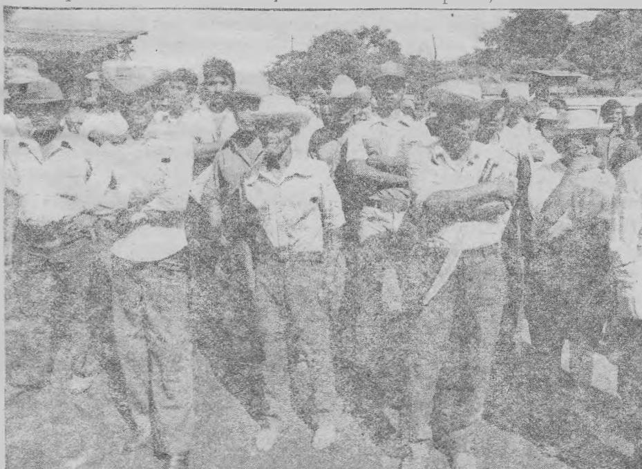
Una minoría de campesinos se han beneficiado con la reforma agraria en El Salvador.

Al occidente del país, en gran parte no afectaba por los combates armados, un 600/o de todos los beneficiarios potenciales tienen ya sus títulos provisionales de tenencia, pero en la región nor-oriental, donde se concentran los combates, sólo un 100/o de los beneficiarios potenciales tiene ya esos documentos.