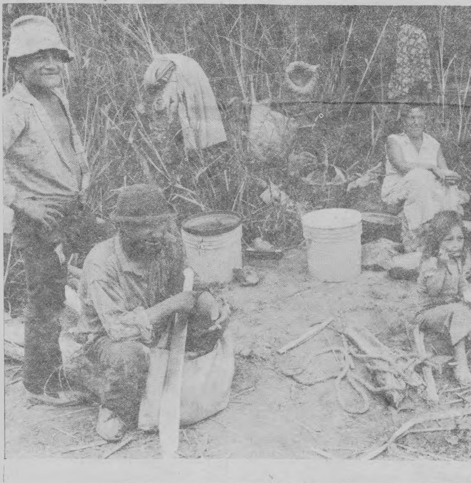
Cerca de un cuarto de millón de refugiados salvadoreños viven fuera de su país.

Según el Consejo de Iglesias Canadiense la situación de los campos de refugiados en Honduras era comparable con la de los campos palestinos de Sabra y Chatila, en Beirut. El Consejo, en su informe a las Naciones Unidas, acusa a los militares hondureños de haber participado directamente en la represión contra los refugiados. "Un gran número de ellos, afirma el Consejo, fueron asesinados y miles son perseguidos y aterrorizados. Los trabajadores