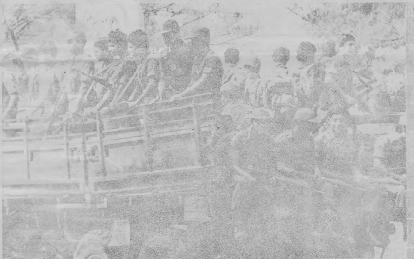
Las tropas salvadoreñas entrenadas en los Estados Unidos (foto) no pueden con un ejército popular.

(Resumido de: "La autoridad de un individuo sin autoridad", publicado en "El Universitario", San Salvador, septiembre).