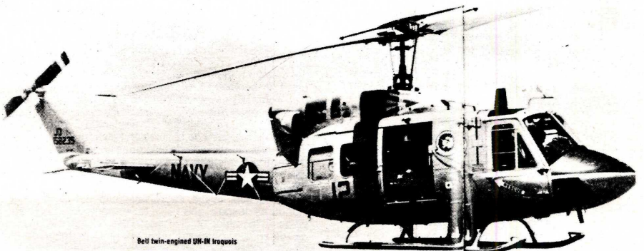
Bell twin-engine UH-1H Iroquois

Por otra parte, los Estados Unidos han hecho desde hace dos años importantes movimientos militares y redistribución de sus fuerzas en la Cuenca del Caribe; entre las que podemos mencionar: