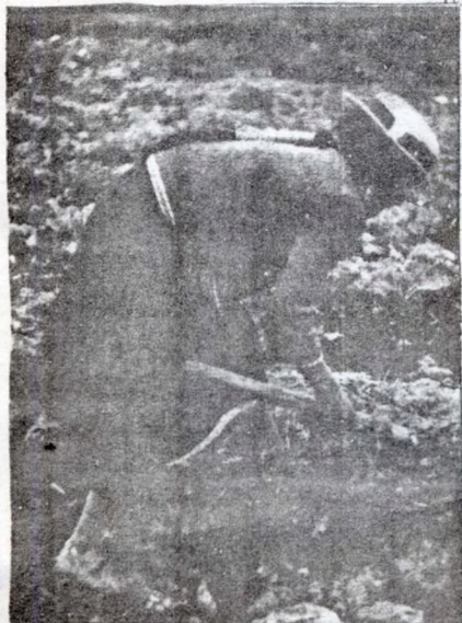
Una vida que se queda en la tierra ajena.

ESTE ES EL CICLO DE LA MUERTE, EL DE LA VIOLENCIA PACIFICA: