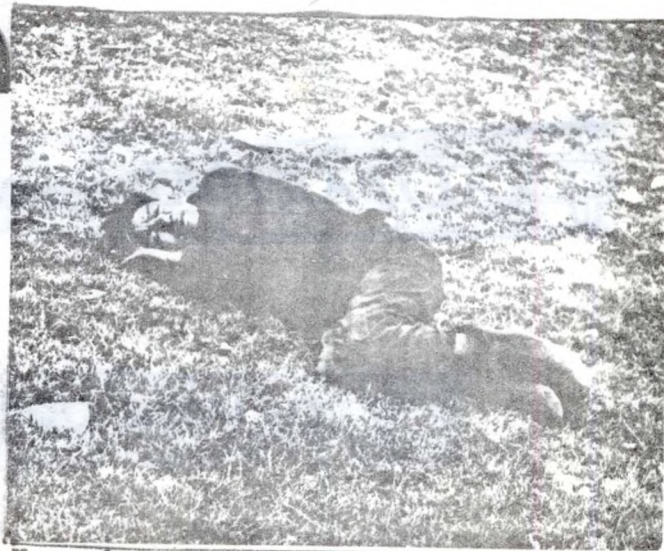
Una víctima anónima